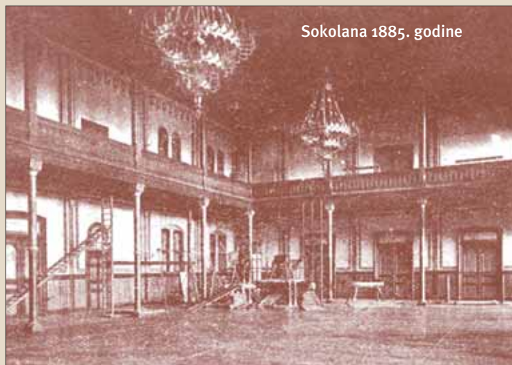
Sokolana 1885. godine

Karta koja je omogućavala vježbanje u Singerovoj dvorani