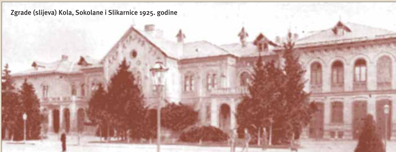
Zgrade (slijeva) Kola, Sokolane i Slikarnice 1925. godine

U "Sokolani" počelo je i sportsko mačevanje. Učitelj mačevanja, major August Piazza je 1893. godine na istočnom balkonu prvi put u Zagrebu prikazao sportsko mačevanje sa svojim prvim učenicima, Tomislavom i Rudolfom Vrbančićem, Nikolom Košćecom i Franjom Durstom. U toj dvorani održana je prva i druga zabava Hrvatskog Akademskog Športskog Kluba 1910. i 1911. pod nazivom Gaudeamus ,