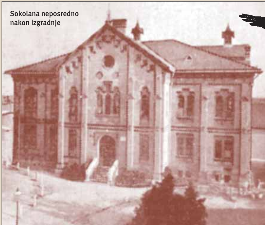
Sokolana neposredno nakon izgradnje